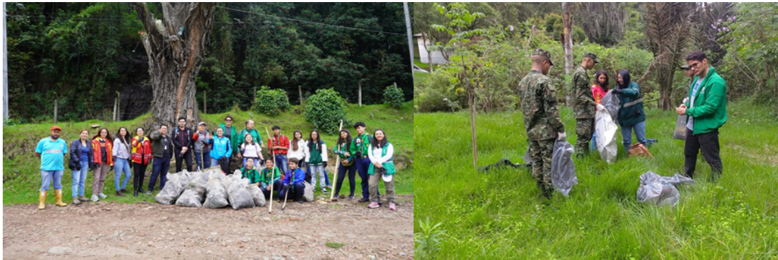
Jornadas de Limpieza

De esta manera, durante el año 2024 y hasta el 30 de abril del 2025, se han desarrollado un total de 770 acciones de educación ambiental relacionadas con la gestión de residuos sólidos. Estas actividades han contado con la participación de aproximadamente 158.350 personas, pertenecientes a: