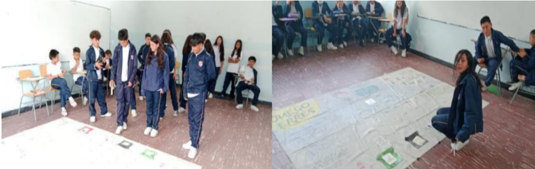
Actividades lúdicas -Separación y Manejo de residuos sólidos